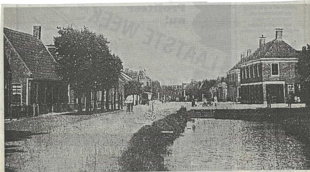
Foto uit plm. 1900 van de haven te Surhuisterveen met de Gedempte Vaart.

"Ontslag van het zoogehate Grietenij Bestuur van Achtkarspelen en verheffing van het dorp tot eene Gemeente met eenen Burgemeester aan het hoofd". Dat was het verzoek in 1830 van een groep inwoners van Surhuisterveen aan de Koning Willem I. Zij deden hun beklag over de 'drukkende belasting, waaronder zij zwoegden'.