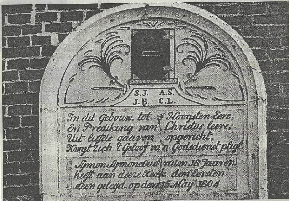
Stichtingssteen boven de deur van de Doopsgezinde kerk te Surhuisterveen uit 1804. In 1614 was er al een Doopsgezinde gemeenschap in het dorp.