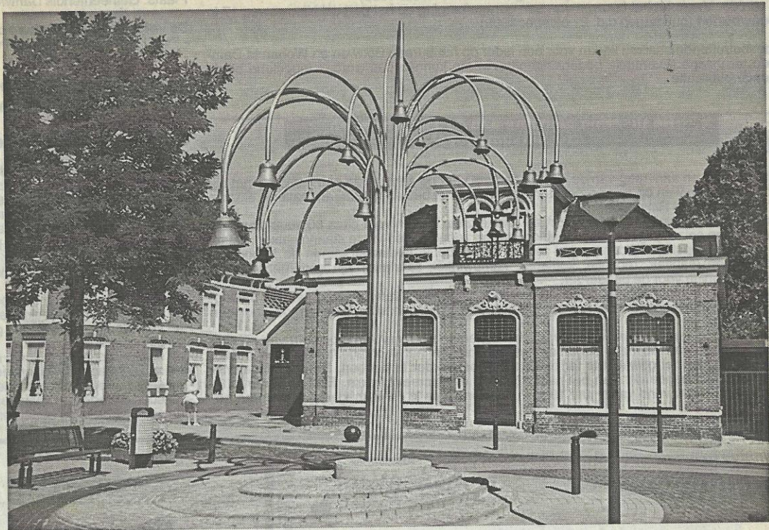
Herenhuis aan De Kolk te Surhuisterveen (gebouwd in 1868). Op de voorgrond het nieuwe carillon.